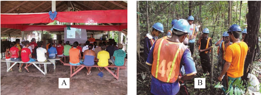
Figura 1. A) Oficina sobre MF-EIR realizado pelo IFT em comunidade remanescente de Quilombo, Oriximiná-PA. B) Curso de capacitação em MF para extrativistas de comunidades de Almeirim-PA.

Este boletim foi inspirado na experiência do IFT junto a diferentes comunidades florestais localizadas nas áreas de influência da BR-230 (Transamazônica), BR-163 (Cuiabá-Santarém), BR-319 (Porto Velho-Manaus) e em alguns municípios da região da Calha Norte do Rio Amazonas (ver Figura 2). Nestas regiões, temos coletado in-